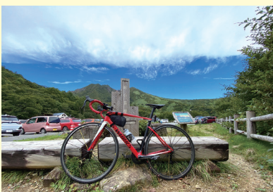
那須町：峠の茶屋にて

那須烏山の美しい景色を堪能するためにサイクリングを始めたのですが、いつの間にかロードバイク（速く走れる自転車）にはまってしまいました。四季を通じて色彩が変化する近所の山、川、田畑を巡るだけでも十分楽しめますが、慣れてくるとどんどん遠くに行きたくなります。最初は拒否感しか無かった服装もコスプレだと割り切ると実は快適です。山の中で森のお友達に出会わないように注意しながら、これからも続けていきたいです。